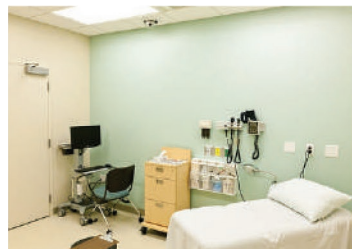
Ambulatori medici o dentistici