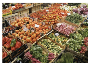
Magazzini conservazione frutta e verdura