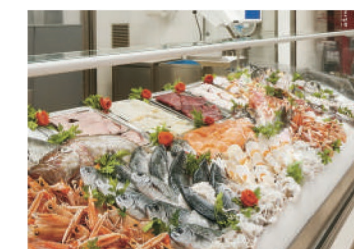
Magazzini conservazione pesce